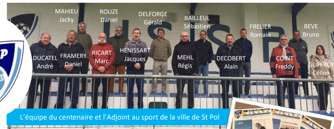
L'équipe du centenaire et l'Adjoint au sport de la ville de St Pol